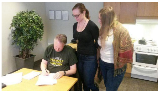
Maktövertagande. Bild: Belewien.