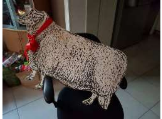
"Får" och "trädgård" definieras lite löst.

Inrikeskanslern önskar påminna om hur en ansökan korrekt lämnas till Rådet: På ett får i Regentens trädgård.