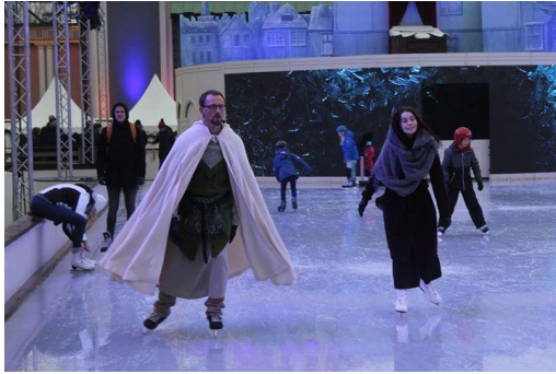
Glidalver i färd att piruettera

dök en hel hobbitfamilj upp och hurrade på inbyggarna som glatt for förbi på lätta fötter, trots att det föll både snö och lätt regn. Inget kunde sänka vårt humör! Några unga besökare från norr frågade, på ett svårtytt tungomål, vad vi var för några filurer och om vi till och med skulle delta i uppträdandet samma eftermiddag. Vi tackade för förtroendet, men förklarade att vi var inbyggare från Mithlond. De små godtog förklaringen och fortsatte att heja på både oss och de sina som följt med dem från norr.