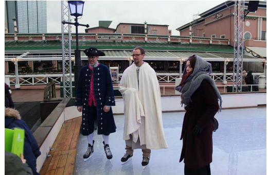
Det är kallt i Helcaraxë (Bild: Gwindor)

Till slut fann vi ett värdshus med en lång trappa som ledde upp till andra våningen. Vi slog oss ned vid ett runt bord och beställde mat och dryck. Där kunde vi sträcka ut våra trötta ben och värma våra kalla kroppar vid elden. Dessutom fick våra fuktiga rockar och mantlar behövlig tid att torka. Här och där hördes de glada rösterna från fler tillresta marknadsbesökare från norr.