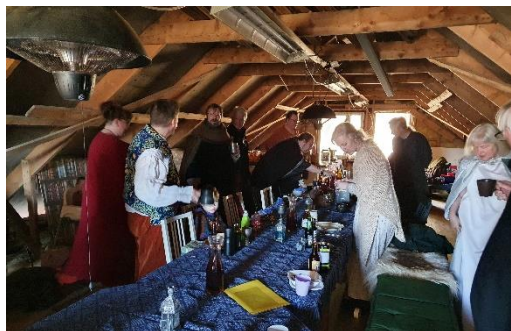
Samling i piratens båtskjul.

Det kändes nästan lite ovant att åka iväg och fira Nyår någon annanstans än hemma vid palantírs-kärmen. Så har vi ju gjort de senaste två åren och det har fungerat ganska bra, med tanke på omständigheterna. Men nu var det alltså dags igen, ett riktigt midgårdar nyårsfirande, med festlokal, full dräkt och ceremonier utomhus i det vackra vädret.