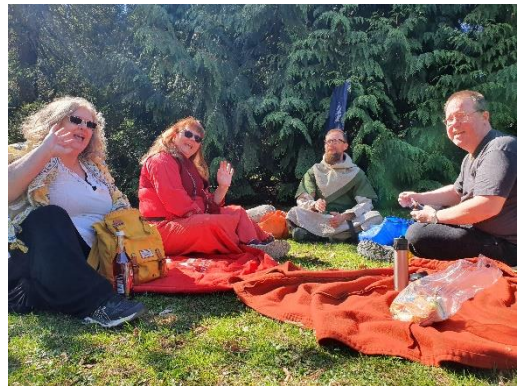
Mantelpicknick med resestandar.

Under Nyårsfesten blev Spirea inspirerad att ordna fler festligheter. Sagt och gjort, Bokgillet ansökte om april Riksmöte vilket faktiskt även blev av, trots viss närvaro av virus och sordinläggande, härjande orker i öst.