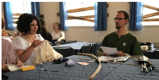
Lotsen håller ögonen på oss.