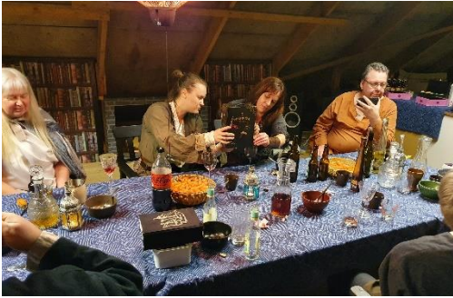
De blå dukarna gör tjänst igen.

I år var vi bjudna till piratens gamla båtskjul, utgård beläget i Hålanda utanför Skepplanda, den 19:e mars. Cimnolwë och Azruzagar har tagit över en gård med loge, vindskydd, skog och katt, med andra ord allt som behövs för att inhysa alla sorters mithlonditer.