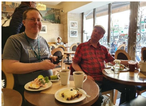
Bokgillet på Ljunggrens café.

På den uppdaterade Väven står det braskande att Mithlond återigen träffas regelbundet för Mithlondpub och för Bokgillesmöten. Likaså har Spelgillet kunnat börja samlas igen hemma hos Matgillet och Regenten håller även fortsatt liv i Rådasjön-runt-gillet. Vi kan i detta nummer även läsa att Konst- och Hantverksgillet drar igång igen. Pust! Så många gillen! Vi behöver nog någon för att hålla reda på dem alla och därför söker Grå Rådet nu en ny Tingsmästare.